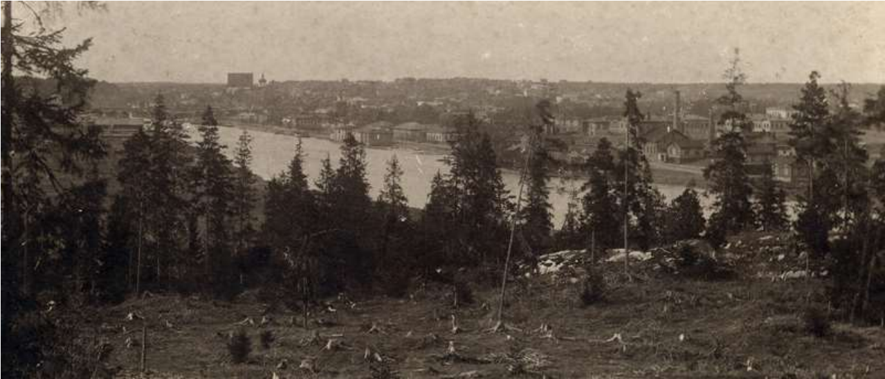
Kuva 4 .Näkymä Kokonniemeltä kaupunkiin 1800-luvun lopussa.

Kokonniemen metsillä katsottiin olevan terveysvaikutuksia jo 1910-luvulla. Sinne johti metsäpolkuja Porvoon tuberkuloosiparantolalta 1920-luvulla. Kaupunkilaisten ulkoilu Kokon metsissä vilkastui 1950-luvulla, kun Mannerheiminkadun silta valmistui. 1950-luvulla rakennettiin hyppyrimäki ja laskettelurinne sekä ensimmäiset ulkoilutiet. Joitakin niittyjä ja hakkuuaukioita metsitettiin jalopuilla ja lehtikuusilla. Kuntayhtymä rakensi 1980-luvulla Kokonniemen urheilulaitokset ja ulkoilumetsään valaistut lenkkipolut, latureitit ja laskettelukeskuksen. Myös ratsastustalli aloitti toimintansa 1980-luvulla.