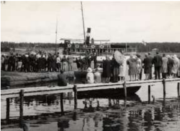
Kuva 1-3. Kokonniemen kansanpuiston alkuperäinen suunnitelma on säilynyt. Ilmakuva ja valokuva ovat 1950-luvulta.