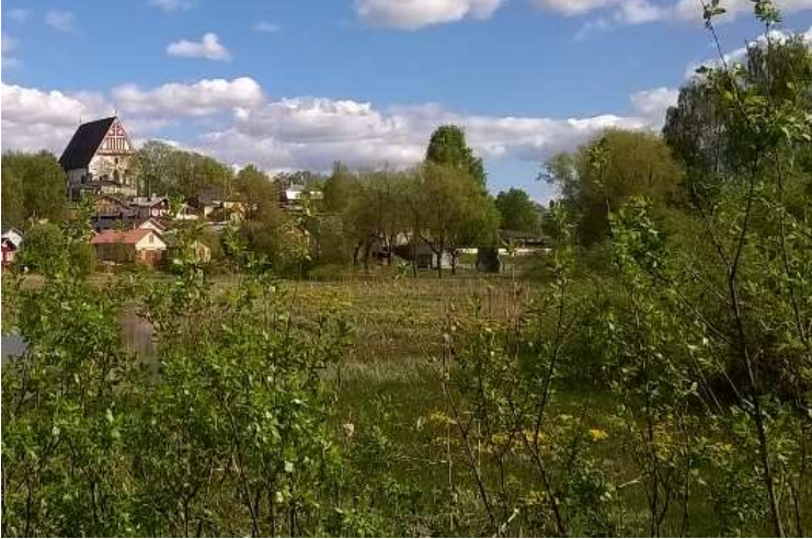
Kuva 21. Maarin niemen nurmella vietetään aikaa, vanhaa hiekkarantaa ja betonista kaidaa, ja pienvienelaiturit sekä Maarin lahden luonnonmukainen ranta. Valokuvat on otettu Maarin niemellä toukokuussa 2016.