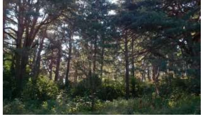
Kuvat 12-16. Näkömääaukko Linnamäeltä jokilaaksoon on hyvin kapea. Vallihautojen muoto peittyy tiheään lehtipuuvesakkoon. Vanha peltotie on ulkoilukäytössä. Perinneaita rajaa Maariin palautetun laitumen. Ilmakuvassa näkyy Vanhaa Porvoota, Linnamäkeä, joen rantareitti sekä Maarin lahti.