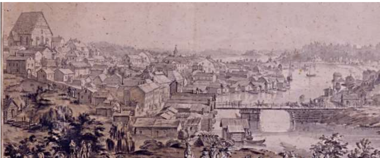
Kuva 4. F.A. Von Numers Laveeraus 1789.