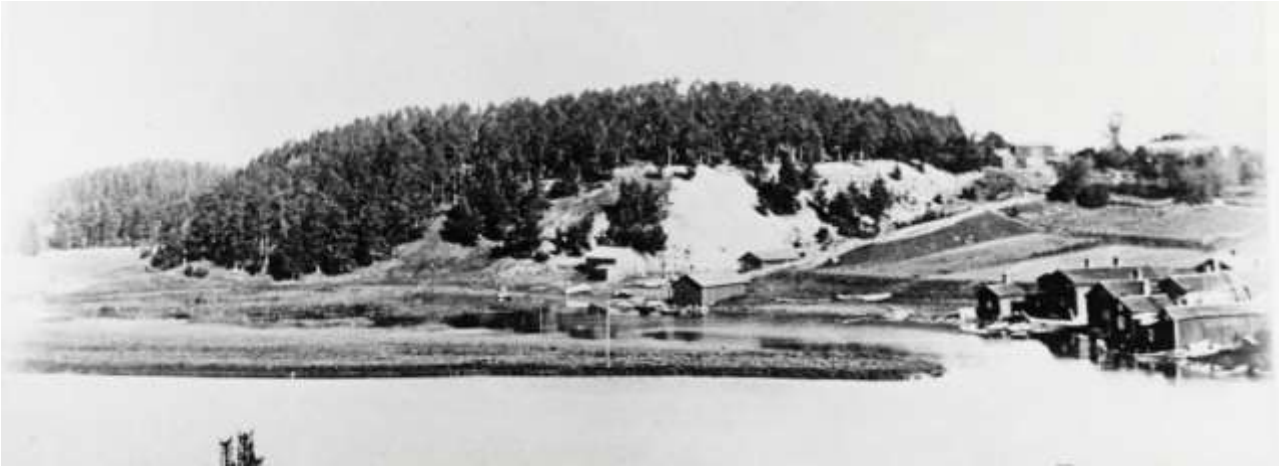
Kuva 8. Valokuva Linnamäestä ja Maarista 1890-luvulta. Pappilan talousrakennukset erottuvat kuvassa oikealla vallirinteen päässä. Kärrytie johtaa pappilan talouskeskukselta alas Maarin rantaan ja jatkuu Linnamäen lievettä seuraten Maarin niemelle ja jokirantaan, missä oli silloin laajat laitumet. Tämä tie erottuu nykyisin maastossa polkuna.

Maarin niemi on niin matala hiekkasärkkä, että se lienee tullut meren pinnasta esiin vasta 1600-luvulla. Silloin Linnavuoren puupaalutukset olivat jo raunioitumassa. Maarin lahden ja rantojen kasvilajisto on poikkeuksellisen rikas. Lajistoa kartoitettiin jo 1800-luvulla ja kasvilajiston kehitystä seurataan edelleen. Lajiston muutokseen vaikuttavat veden laadun muuttuminen, lahden rehevöityminen ja madaltuminen maan kohotessa, sekä veden huono vaihtuvuus kapenevan suuaukon kautta. Suolaista merivettä työntyy Maariin asti vain harvojen meritulvien aikana. Vesi vaihtuu enemmän makeasta vedestä, jota tulee sadevedestä ja Linnamäeltä suotautuvana lähdevetenä.