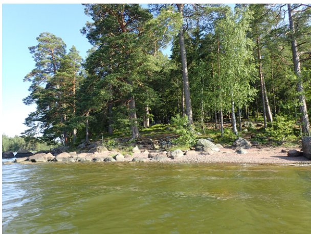
Kuvat Mäntysaaresta ja Stornäsuddenin rannasta.