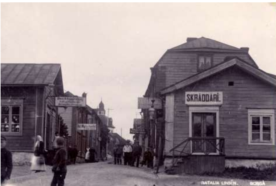
Kuva 1 Kirkkokatua 1900-luvun alussa.

Empiretyylisuunta vaikutti rakentamiseen ja rakennusten ulkoasuun myös Vanhassa Porvoossa 1800-luvulla, vaikka katuverkkoa ei suoristettukaan. Paloturvallisuussyistä suositeltiin lehtipuiden istuttamista ja hedelmäpuiden määrä kasvoi. Katunäkymiä rajattiin tiiviillä umpiaidoilla. Niiden yli näkyi paikoin syreenipensaiden ja hedelmäpuiden latvuksia sekä muutamalla tontilla muotoon leikattu jalopuu. Kauppatujen ilme muotoutui 1800-luvun lopulla, kun puodit ja verstaat lisääntyivät ja julkisivuihin puhkottiin näyteikkunoita.