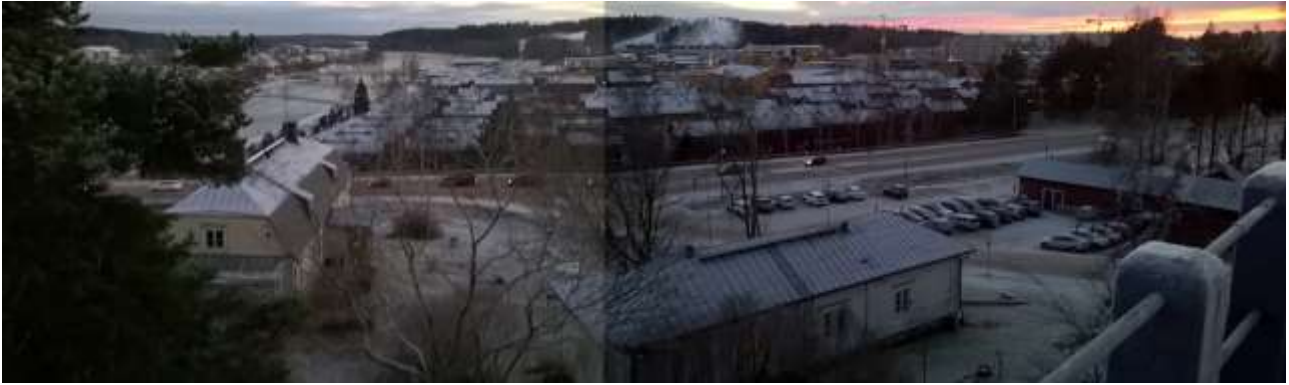
Kuva 10. Talvinen näkymä Näsän kiveltä.

Maisematila on jännittävä tiukasti rajautuvana jokilaakson kapeikkona. Rannan käyttö ja luonne ovat rakennusten, teiden ja junaradan eri rakentamisvaiheiden ja purkutöiden jäljiltä muuttuneet monta kertaa. Nykyinen hahmo on heikko.