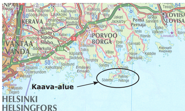
Kuva 1. Kaava-alueen sijainti

Kaava-alue sijaitsee Porvoossa, Porvoon keskustasta noin 22 km kaakkoon. Suunnittelualueen pinta-ala merialueet mukaan lukien on noin 250 km 2 . Alueeseen kuuluu Pellingin ja Sundön kylät sekä osia kylistä Kalax, Kuris ja Jakari.