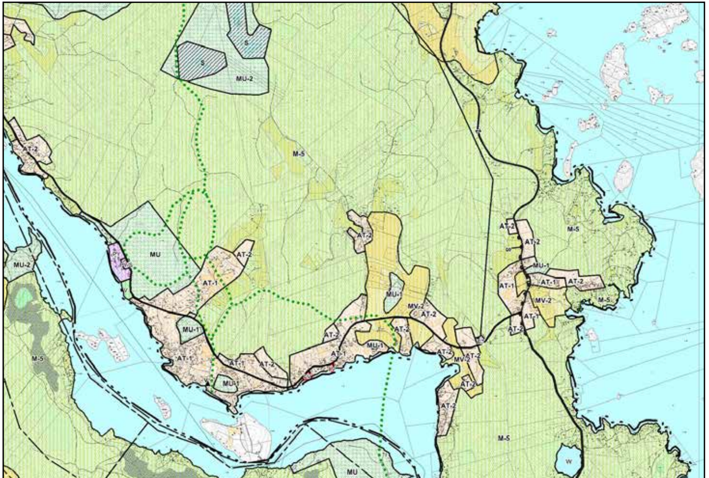
Kuva 3. Kylien ja haja-asutusalueiden osayleiskaava