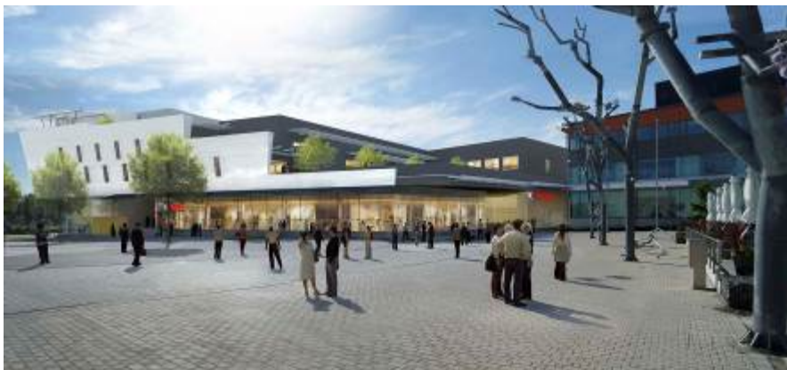
Utsikt från nordnordväst från Konstfabrikens huvuddörr över Alexanderskvären. Illustrationen visar antalet tillåtna reklamanordningar samt deras placering. ARRAK Arkkitektidit Oy, 22.11.2016.

Takformen eller takmaterialet har inte fastställts. Taket ska vara så svagt sluttande att det inte bildar en dominerande del av fasaden i gatubilden eller fasaderna mot ån. För byggnadsytorna mot Borgå å anvisas det högsta tillåtna höjdläget för taket i detaljplanen. Det är också möjligt att på taket placera små tekniska anordningar, såsom fläktar och gångbroar.