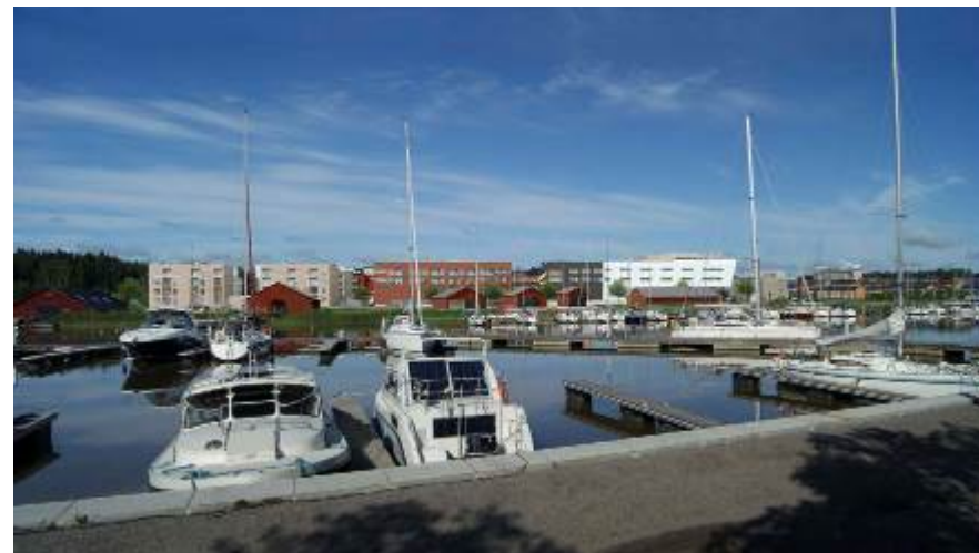
Utsikt mot området från empirecentrum.