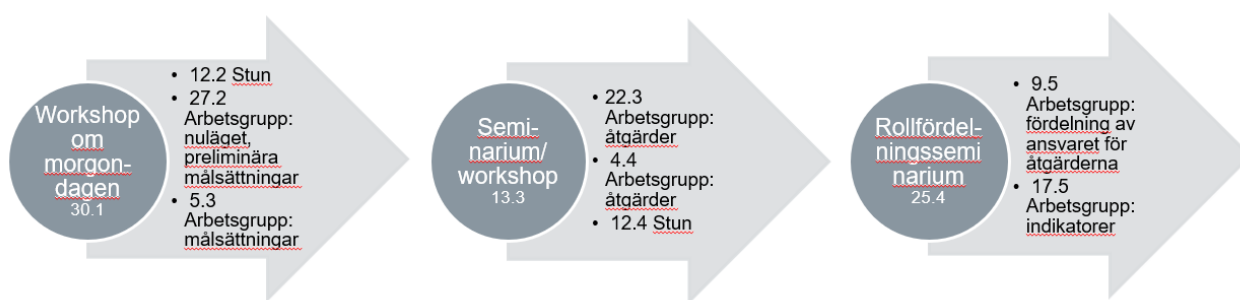
Bild 1. Processen för beredningen av programmet

Vi byggde upp programmet genom ett intensivt samarbete med förtroendevalda, företag, företagare och läroanstalter. Förutom arbetsgruppens möten ordnades två workshoppar/seminarier, där man diskuterade programmets innehåll tillsammans med deltagarna ovan. Vid det första seminariet/workshopen diskuterades idéer för hur åtgärder för att uppnå de mål som arbetsgruppen ställt upp. Vid rollfördelningsseminariet avtalade vi gemensamt om ansvarsfördelningen vid förverkligandet av åtgärderna. Beredningsprocessen för programmet beskrivs på bild 1.