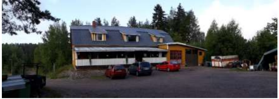
Valokuvat entisestä lestitehtaasta Mosabackantieltä ja rakennuksen pihasta.