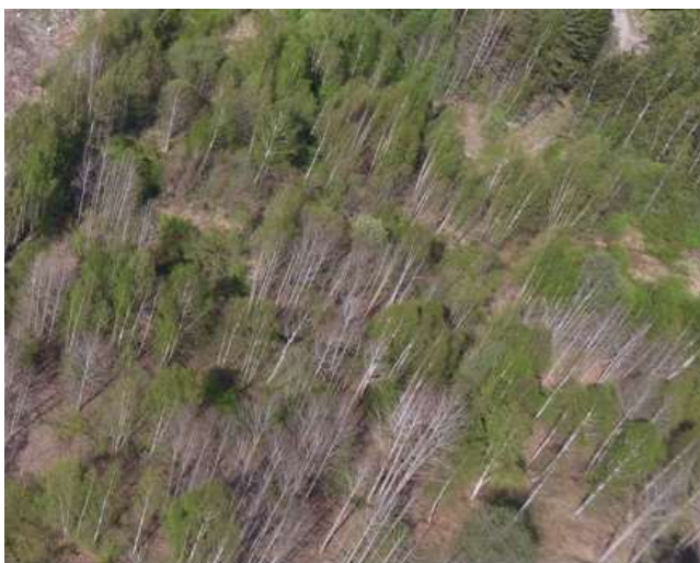
Kuva: Viljelyn ja niiton loputtua rehevälle maalle on kasvanut luontaisesti kylväytyviä lehtipuita ja joitakin mäntyjä. Kuusien taimet alkavat yleistyä noin 10-20 vuotiaan lehtipuuston ja pajukoiden suojassa.

Myös pihapiireissä kasvilajisto köyhtyy, kun perinteinen pihapuutarhojen hoito vähenee ja varjostus lisääntyy. Metsäisillä tonteilla kuusettumisen ja muun puuston kasvu aiheuttavat varjostusta. Elonkirjo köyhtyy, kun vanhat perinnekasvit ja kulttuurin seuralaislajisto vähenevät ja niistä riippuvainen eliölajisto vähenee. Myös runsas ja monilajinen linnusto tulee oleellisesti vähenemään, kun elinympäristö yksipuolistuu ja sen myötä monipuolinen ravintokasvien ja -hyönteisten lajisto ja yksilömäärät vähenevät.