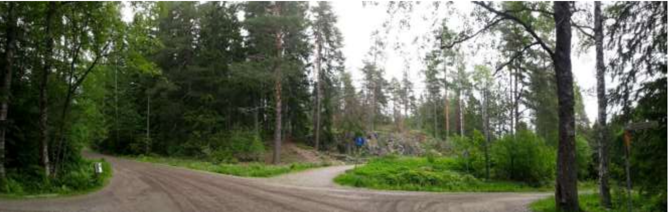
Kuva: Vanhan Veckjärventien mutkassa on tiheä metsikkö. Mutkassa tiehen liittyy pyörätie Itätuulentielle johtava Skaftkärrintie ja täyttöalueelle johtava ajotie.

oikea-aikaisin harvennuksin jatkuvalla kasvatuksella, voi puusto kestää ympäristön rakentamista ja muodostua rakentuvan alueen kaupunkikuvassa tärkeäksi metsiköksi. Lakialueelta ei ole pitkiä näkymiä laaksoon. Laella kulkee useita polkuja, jotka ylittävät mukulakivien kasaumia. Rinteeseen on rakennettu kallion reunaan myötäilevä pyörätie, joka johtaa Punakanelintien päästä Vanhalle Veckjärventielle.