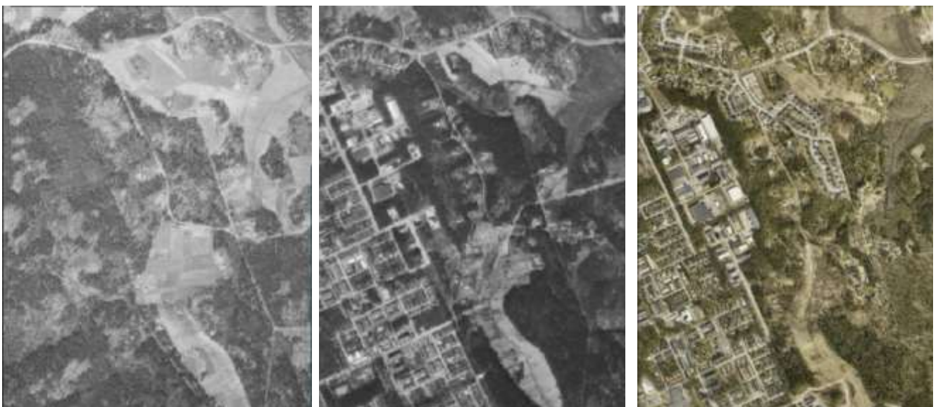
Kuvat: Ilmakuvat vuosilta 1950, 1986 ja 2020.

Kevätkummun asuinalue kaavoitettiin harjumoreeniselänteelle 1970-luvulla. Tarmolan teollisuusalue alkoi rakentua 1980-luvulla. Vanhan Veckjärventien varrelle rakennettiin muutama tiiliverhottu asuintalo ja työtiloja ajan tyylin mukaan 1980-luvulla. Skaftkärrin laaksossa maatalouden merkitys väheni nopeasti 1970-luvun lopussa ja laidunnus loppui. Se merkitsi sitä, että avoimet niityt ja pellot alkoivat metsittyä. Maatalouteen liittyneet tuotantorakennukset ja eläinsuojat raunioituivat vähitellen tai ne purettiin. Myös maatalouden työväen asunnot ja sivurakennukset vähenivät ja niihin liittyneet pienet kotitalousviljelykset ja puutarhat autoituivat ja alkoivat metsittyä.