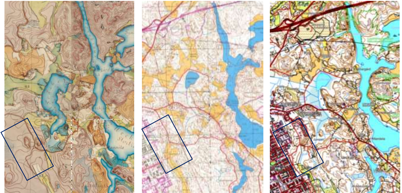
Kuvat: Senaatinkartta 1870-luvulta ja peruskartat vuosilta 1988 ja 2022. Kaava-alueiden 453 ja 478 likimääräinen sijainti on rajattu suorakaiteella.

Asutus levisi 1900-luvun alussa vanhojen teiden varsille Porvoon ja kylien lähiympäristössä. Kallioiden ja metsäisten kumpareiden väliin rakennettiin pieniä asuintiloja pihapuutarhoineen. Mäkien alarinteiden hiekka- ja hietavyöhykkeillä asutukseen liittyi tuottoisia puutarhoja ja reheviä pihapiirejä. Skaftkärrin laakson reunoilla oli 1800-luvun lopussa kaksi torppaa. 1900-luvun puolivälissä palstoitettiin siirtolaisasutukselle Veckjärventien varsille noin hehtaarin kokoisia metsäpalstoja asuintiloiksi. Skaftkärrin laaksoon vähän suurempia tiloja maataloustuotantoon. Alue oli siten pääasiassa metsä- ja maatalousaluetta. Laajimmillaan peltopinta-ala oli luultavasti 1950-luvun lopulla.