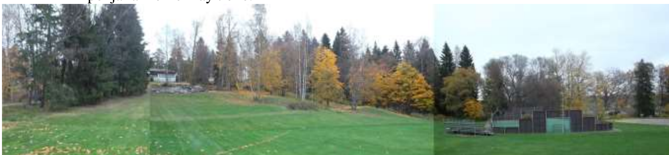
Valokuva rakentamattomien tonttien alueesta, jolla golfkenttä ja ulkopelien alue hoidetaan yhtenäisenä nurmikenttänä. Ne määrittävät alueen urheilun maisematilaksi. Vasemmalla näkyy kuusiainne, joka luultavasti istutettiin jo 1860-luvulla perustetun hedelmätarhan suojaksi. Se oli aluksi leikattu.

Kun ulkoliikunta korostui, rantavyöhykettä laajennettiin pelikentän vuoksi. Entisen hyötypuutarhan alue muutettiin luultavasti 1980 luvulla golfkentäksi ja muiden ulkopelien alueeksi. Puutarhaa rajannut kuusiainne oli alun perin leikattu noin kaksi metriä korkeaksi, mutta leikkaaminen lopetettiin luultavasti silloin kun hedelmätarhan tuotannollinen käyttö loppui. Nykyisin kuusiainnasta on jäljellä huonokuntoisia osia eikä se enää muodosta yhtenäistä maisemallista rajaa laaksoon päin. Sen sijaan Haikkoontien katutilaan se muodostaa paikoin selvän rajan. Haikkoontieltä on alarinteessä näkymä merelle lehdeettömään aikaan. Laakson pohjalla meri ei näy tielle.