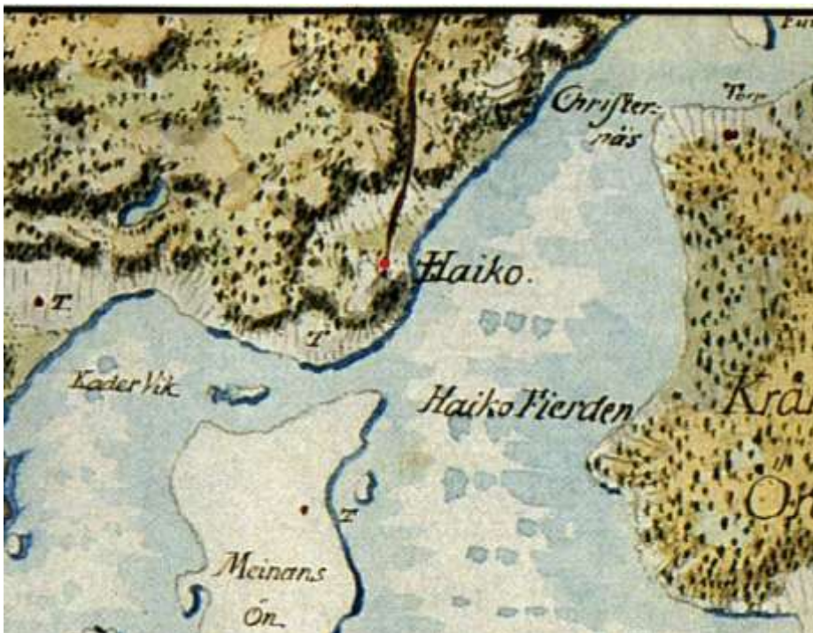
Ote ns. Kuninkaankartastosta v. 1798-1804