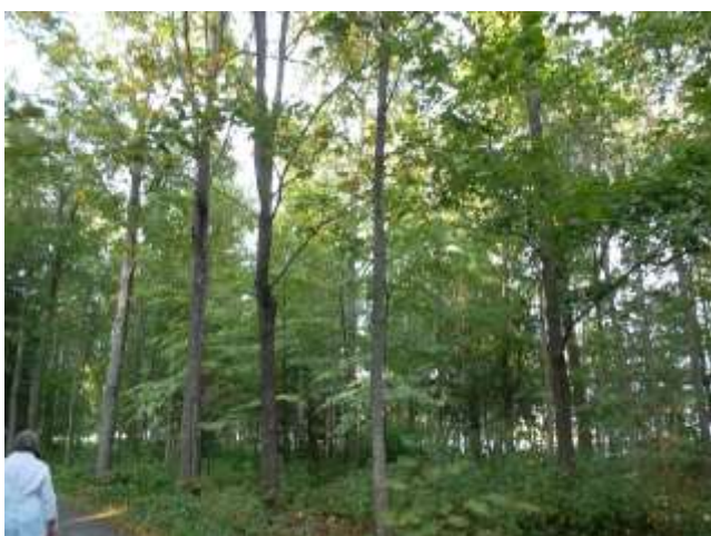
Valokuva niemen kärjen nuoresta puustosta liikuntatapahtumasta sekä maisemapuistossa vuonna 2014.

Laakson pohjalle tasamaastoon entiselle peltomaalle perustettiin kohotettu yrttitarha ja pienimuotoinen hedelmätarha 200-luvun alussa. Suurin osa entisestä peltomaasta laakson pohjalla on metsittynyt ja kasvaa noin 30-vuotiasta koivuvaltaista lehtimetsää. Siitä olisi helppo kasvattaa puistomainen koivikko harventamalla nuorta puustoa. Koivikkoa on kasvatettu rantapuustona luontaisen tervalepän sijasta täyttömailla jo 50-vuoden ajan. Myös ravintolapaviljongin ympärille kasvatettiin koivikko 2000-luvun alussa. Myrskytuho 1990-luvun lopussa kaatoi paljon puita. Varsinkin vanhoja kuusia kaatui niemen kärjessä ja kartanorakennuksen vierellä. Uudisistutuksia tehtiin heti seuraavina kesinä tammilla, metsälehmuksilla ja männyillä. Puistossa on luontaista kuusen taimikkkoa.