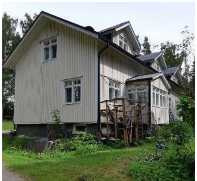
24 jälleenrakennuskauden rakennus