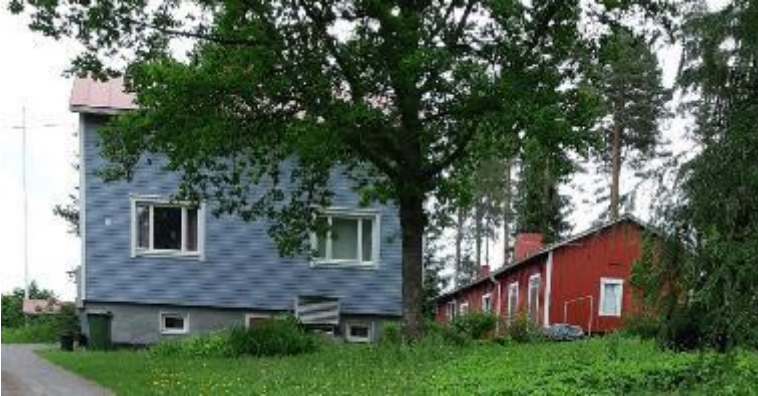
27 Rintamamiestalo ja sivurakennus

Rakennusvuosi: 1953 ja 1959 Väritys muutettu. Sivurakennusta laajennettu.