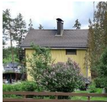
17 Rintamamiestalo ja talousrakennus

Rintamamiestalon väri, kate ja ikkunoita on vaihdettu. Vanha sauna on purettu. Työtilaa on muutettu.