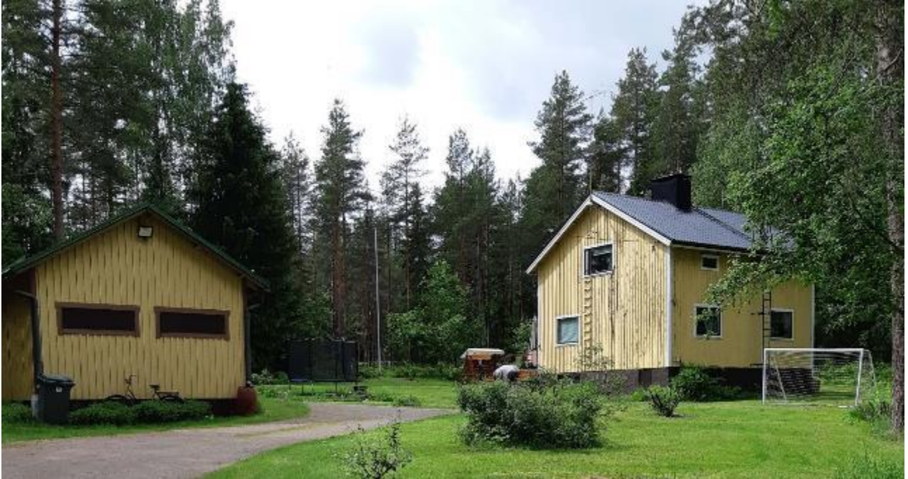
8 Talousrakennus ja rintamamiestalo

Katto uusittu, väritys ja ikkunat vaihdettu.