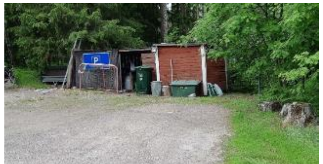
6 Talousrakennus ja katoksia