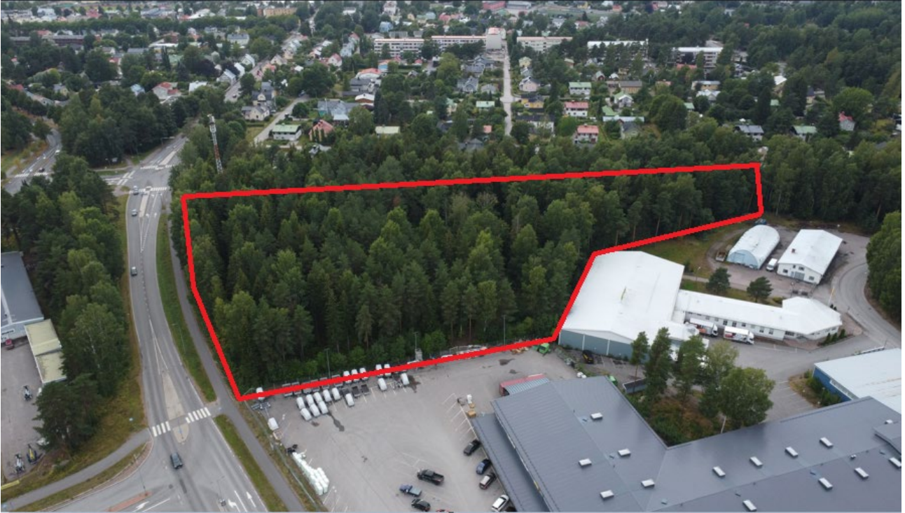
Kuva 3 Suunnittelualueen metsikkö viistoilmakuvassa 2022

Suunnittelu alue on pääosin tiivistä 50–60 vuotta vanhaa kuusi ja mänty metsää. Metsän läpi kulkee valaistu kevyen liikenteen väylä. Maisemassa metsikkö muodostaa Tarmolan työpaikka-alueelle reunan. Loviisantie kulkee metsikön rajaamassa tilassa.