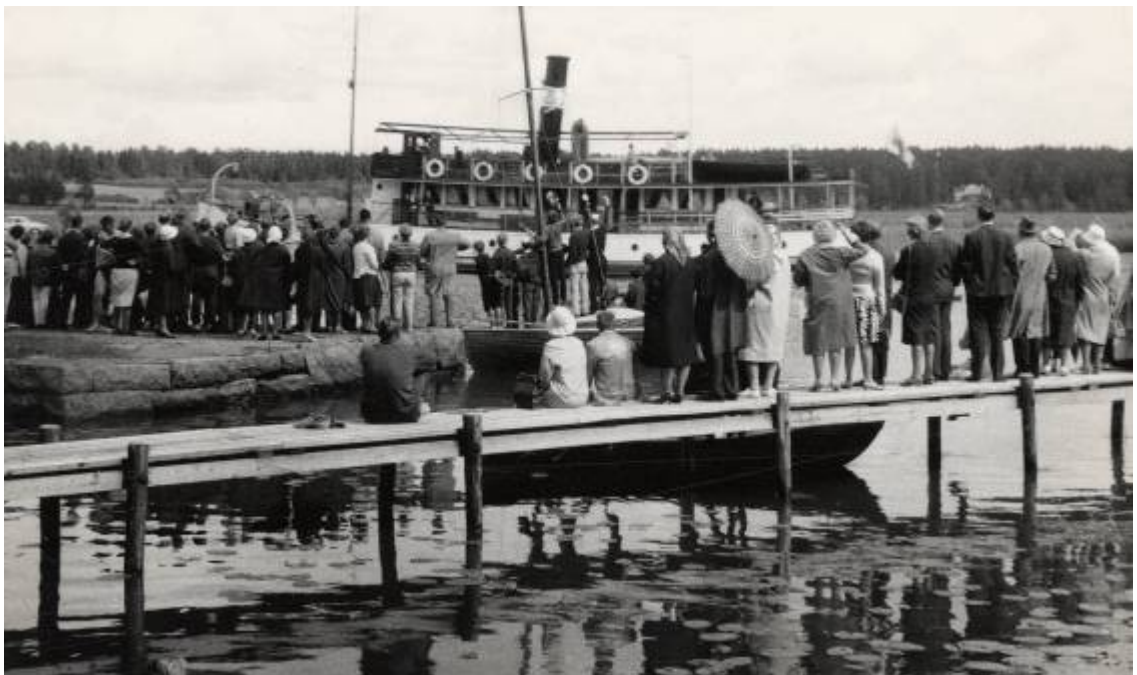
Valokuva Kokkonniemen kansanpuiston laiturista.