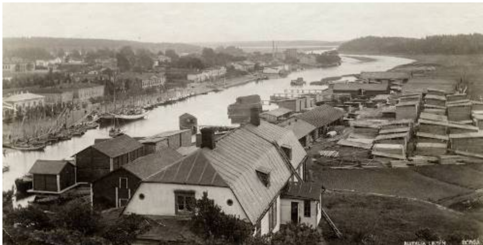
Näkymä Näsinkiveltä kaakkoon, Natalia Linsén 1898, Porvoon museo.

Porvoon Länsirannan suunnitteluhistoria on monivaiheinen. Alue on pitkään ollut kaupungin reunamaata, joka on ollut verrattain rakentamatonta vanhaa viljelymaisemaa ja jota on sittemmin käytetty venetelakka- ja teollisuustoimintoihin. Alueen rakentaminen nykymuodossaan käynnistyi vuosituhannen alussa ns. Moderni puukaupunkialueelta.