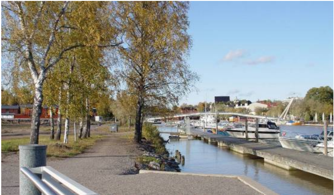
Näkymä Aleksanterinkadun sillalta pohjoiseen 6.10.2008.