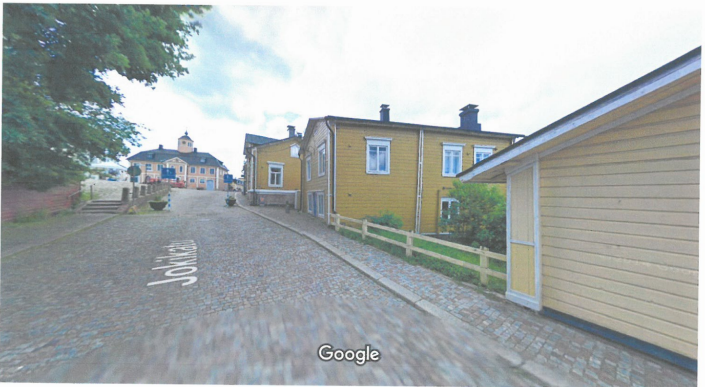
Kuva otettu: kesäk. 2012

Sillanmäessä on tänä päivänä runsaasti päin kiellettyä ajosuuntaa ajoa ja luvatonta pakettiautoliikennettä joka ei ole huoltoajoa.