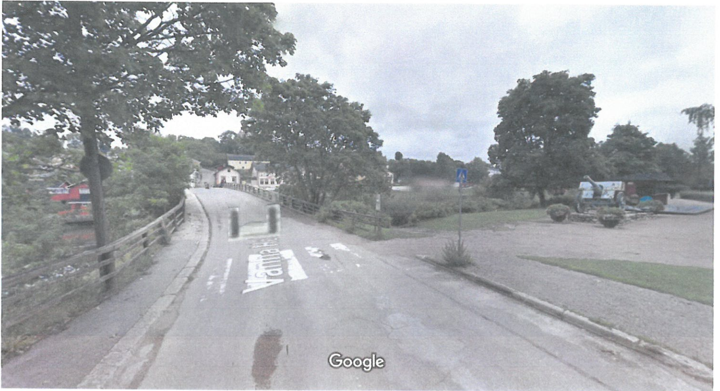
Kuva otettu: elok. 2011