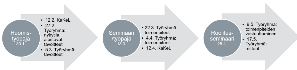
Kuva 1. Ohjelman valmistelun prosessi

Rakensimme ohjelman kiinteässä yhteistyössä luottamushenkilöiden, yritysten, yrittäjien ja oppilaitosten kanssa. Työryhmän tapaamisten lisäksi järjestimme kaksi työpajaa/seminaaria, joissa edellä mainittujen osallistujien kanssa ideoitiin ohjelman sisältöä. Ensimmäisessä seminaarissa/työpajassa ideoitiin työryhmän esittämiin tavoitteisiin toimenpiteitä. Roolitusseminaarissa sovimme yhteisesti toimenpiteiden toteuttamisen vastuista. Ohjelman valmisteluprosessi on kuvattu kuvassa 1.